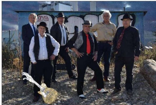
Les Jaguars version 2021, qui jouent du blues et seront Bretzel d'or dimanche à Village-Neuf.

Via les Shadocks et Théorème A suivi le temps des Shadocks, à la fin des années soixante-dix. Mais le groupe qui a compté, c'est Théorème. « C'est ainsi que nous l'avons appelé quand nous l'avons formé. Toutes les années pop... On était arrivé à un niveau musical d'Ange, le groupe bellorain. Et c'est aussi l'époque où nous avons créé le premier opéra rock en Alsace. Clovis ou le comédien humain . Une radio régionale l'a