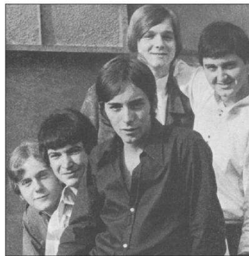
Les Jaguars en 1966.

En alsacien Et de poursuivre : « On a commencé à travailler en anglais. Mais j'étais chagriné. Ce n'est pas ma langue de prédilection. Cela sonnait bien. Mais du blues en anglais... Il y a tellement de bons groupes par ailleurs ! ». Alors, pour se démarquer, il a imaginé de chanter en alsacien, sa langue maternelle. « J'ai traduit une chanson. Et tout le monde était partant. » Les reprises de grands bluesmen ont été une nouvelle jeunesse pour les musiciens des Jaguars.